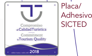
Placa/ Adhesivo SICTED